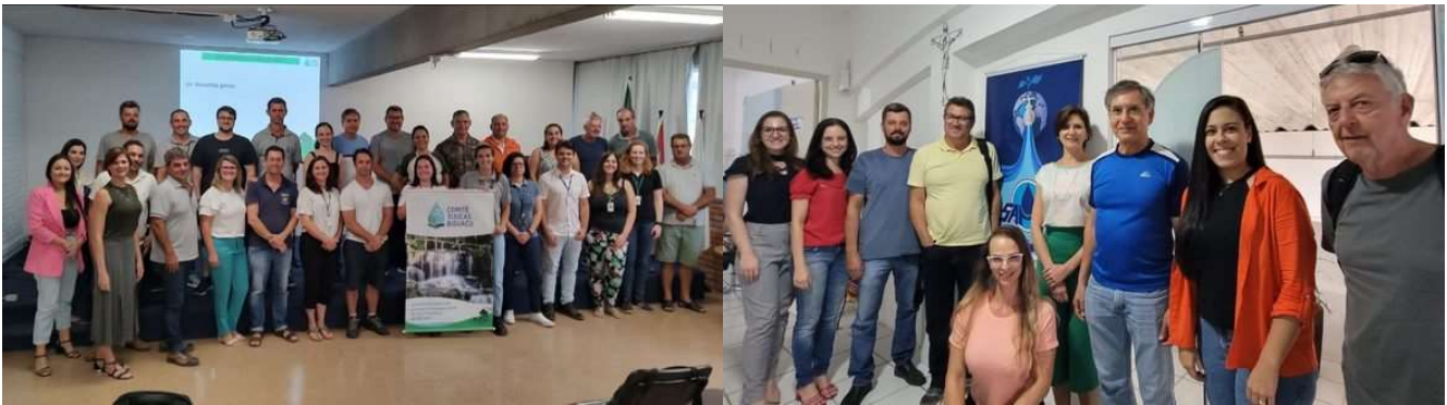
55ª Assembleia Geral Ordinária realizada com o Comitê Tijucas e Biguaçu

Ao longo de janeiro e fevereiro, foram realizadas as primeiras reuniões das diretorias dos Comitês de cada região com o órgão gestor estadual de recursos hídricos, assim como a primeira Assembleia Geral Ordinária do Comitê Tijucas e Biguaçu de 2023. Nesses encontros, foram compartilhados os relatórios de atividades de 2022, e apresentados os principais desafios e objetivos para 2023. Outro momento importante foi a apresentação da nova entidade executiva dos Comitês de Bacias Hidrográficas do agrupamento leste de Santa Catarina, o Instituto Água Conecta.